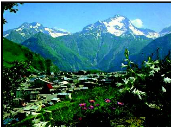
Les Deux Alpes

subota - nedjelja, 12.-20. kolovoz 2017. godine