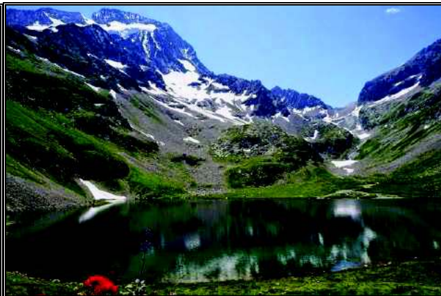
Jezero pod Muzelle