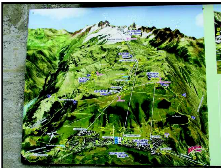
Staze oko Les DDeux Alpes