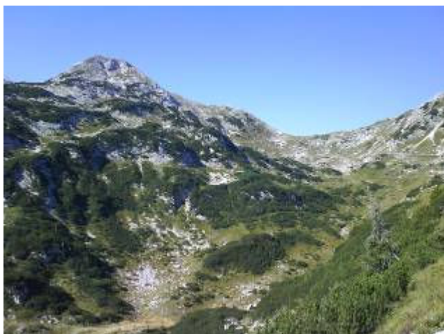
Bogatinsko sedlo i Bogatin