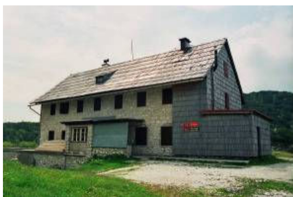
Koča pod Bogatinom