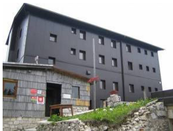
Koča na Komni

SVAKAKO PONJETI: važeću putovnicu (neka bude kod Vas u busu), planinarsku iskaznicu s markicom za 2011. g., dovoljno usitnjenih eura.